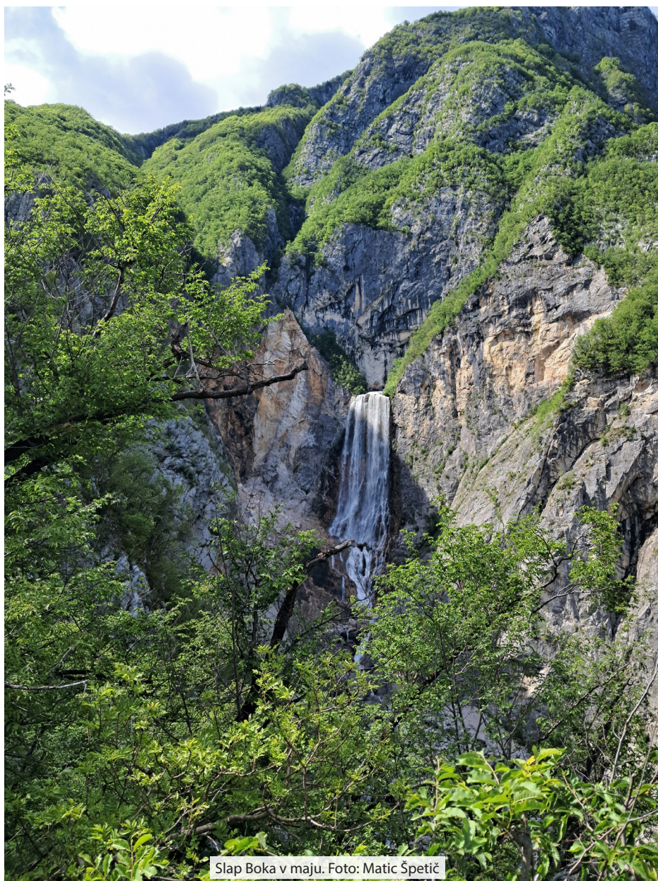
Slap Boka v maju.

Poleg vsega raziskovanja smo organizirali kar nekaj omembe vrednih neraziskovalnih aktivnosti, ki so vedno izpadle povezovalno in spodbudno. Med drugim smo pomagali agrarni skupnosti pri urejanju pašnih površin in zajetja z vodo, obnovi in čiščenju infrastrukture, ki jo uporabljamo, in še kaj bi se našlo. Za možnost uporabe stanu na Planini Poljana se gre zahvaliti predvsem agrarni skupnosti Savica in našim prijateljem iz Bohinja. Prav je, da jim hvaležno povrnemo uslugo in pomagamo z delom, kjer lahko. Kar se mi osebno zdi pomembno je, da za takšne akcije ni bilo potrebnega veliko prigovarjanja. Pa naj bo to delovna akcija, izobraževanje no-