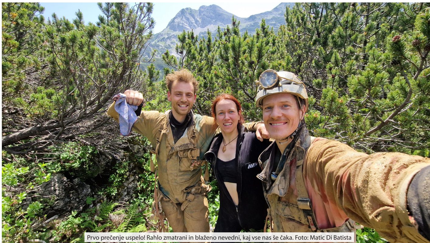
Prvo prečenje uspelo! Rahlo zmatrani in blaženo nevedni, kaj vse nas še čaka.