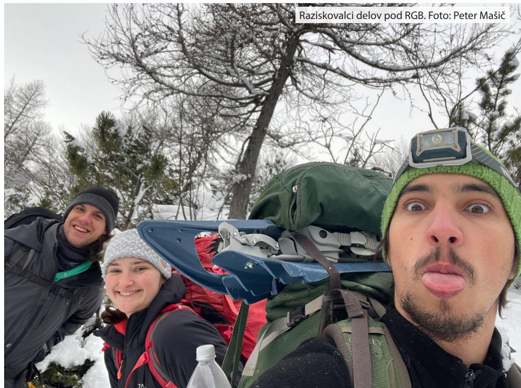
Raziskovalci delov pod RGB.

skozi precej obupen podor, ki se je na drugi strani žal nadaljeval s prostornim rovom. Zakaj žal? Ker bo treba skozi še večkrat. Vida je prvič tako odneslo med bloki, da za nazaj ni več prepoznal prave poti in je iskal mesta, kjer je čutil prepah, da mu je pokazal pravo pot. Rov zadaj se eventuelno prevesi v vodni kanjon. To je bila druga večja tekoča voda v jami. V dveh akcijah smo prišli že do pravega kolektorja, ki se je v dolvodnem delu zaključil s sifonom.