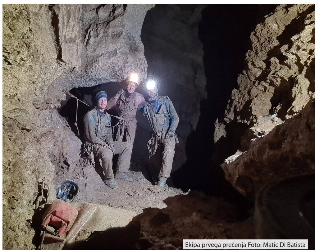
Ekipa prvega prečenja