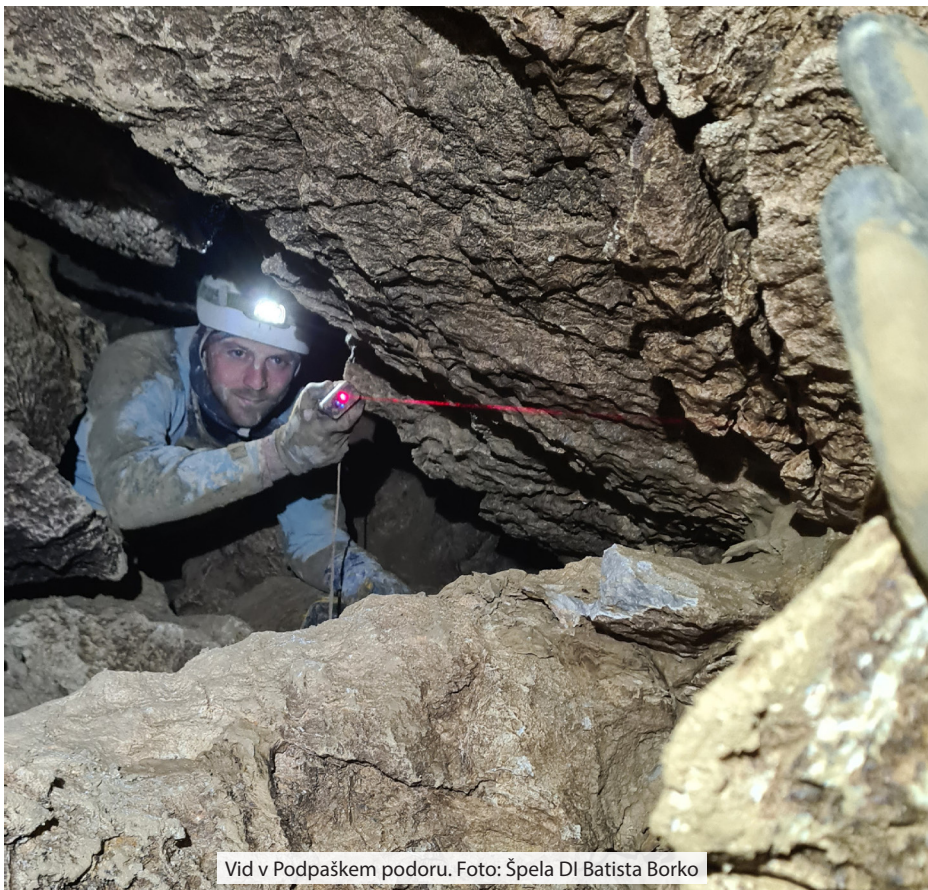
Vid v Podpaškem podoru.

jamski bogovi namenili srečo, se kmalu priključi še kaka jama. Morda celo Dlvn. Vsekakor potencial za dolžino tu ni zanemarljiv. ■