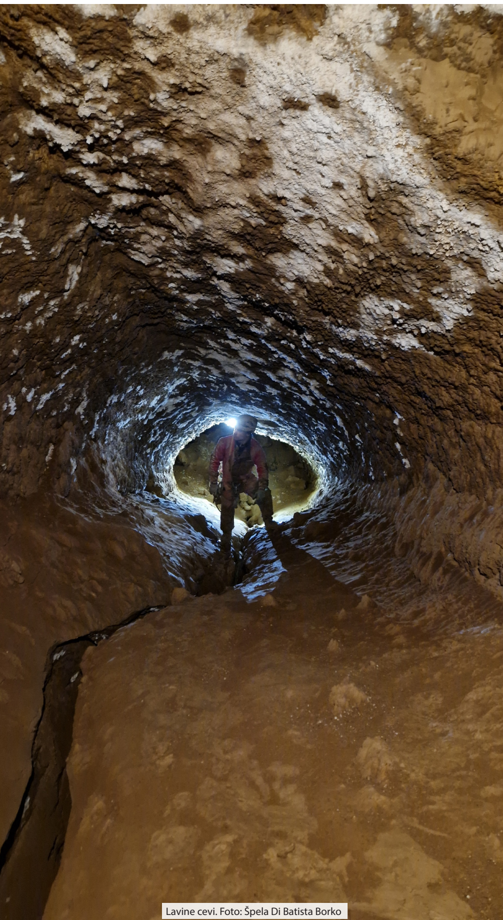
Lavine cevi.

Od zadnjega ovekovečenja raziskav 4-P se je izkušnja obiskovanja drastično spremenila. 300 metrov dolg meander na globini približno 200 metrov danes ni več strah in trepet, temveč le nujno zlo, ki jamarja nekoliko upočasni pri doseganju cilja. Nekaj akcij, na katerih smo gradili karakter, in kaka nesreča so nas spodbudili, da smo jamo pošteno obdelali. Komaj prehodne ožine so danes le še bled spomin, ki se ustno prenaša novim obiskovalcem v stilu: ko smo bli mi mladi ... Ostala je še ena – ožina nad povezavo, ki še vedno ohranja sloves, pa je tudi ta doživela kako silo in čaka bridki konec.