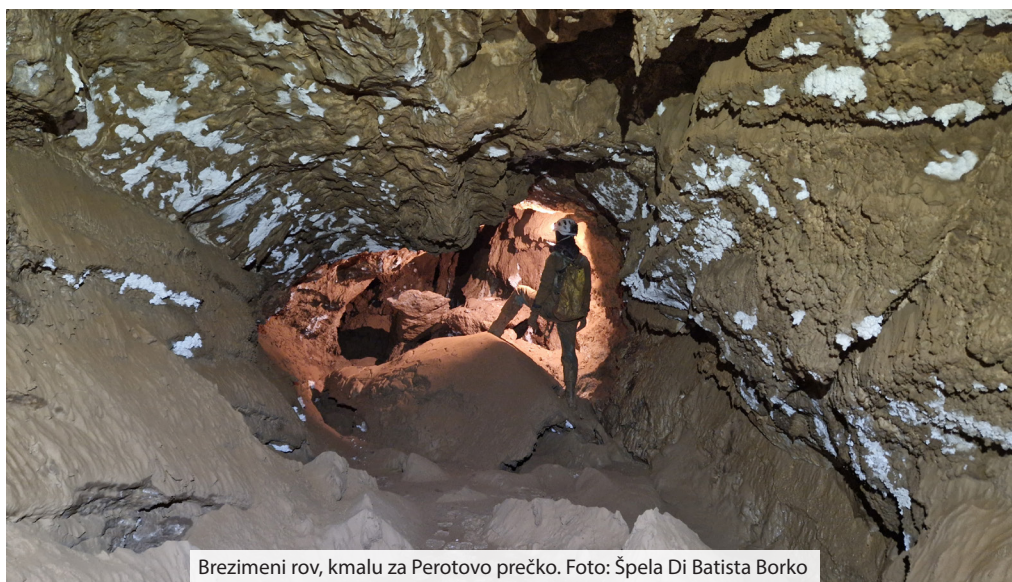
Brezimeni rov, kmalu za Perotovo prečko.

4-P ostaja jama z značajem, čeprav smo ga že precej skrhal. Vtis je hitro popravila v spodnjih delih in začinila raziskovanje. Podobno kot že kakšna jama na Pokljuki, tudi ta zahteva od uporabnika, da jo malo pozabi. Po mojem smo jo dovolj pozabili, kdaj gremo spet? ■