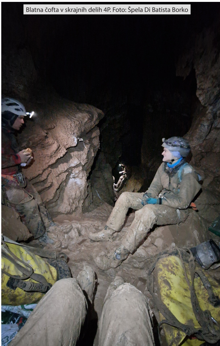
Blatna čofta v skrajnih delih 4P.