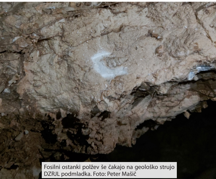
Fosilni ostanki polžev še čakajo na geološko strujo DZRJL podmladka.

li skozi začetno ozko, šodrasto vhodno ožino in se umaknili v prijetnejši hlad. Ker sem bil v tej jami prvič, smo med hojo do vhoda razčistili tudi zmedo glede imena. Da ne bo pomote za nepoznavalce, 4P je na Poljani, in ne gre za P4 na Kaninu. Sledil je spust po breznih in prehod skozi približno 300 metrov dolg meander, po katerem smo dosegli brezno, ki se na globini okoli 365 metrov skozi okno odcepi v nov krak. Ta se pri