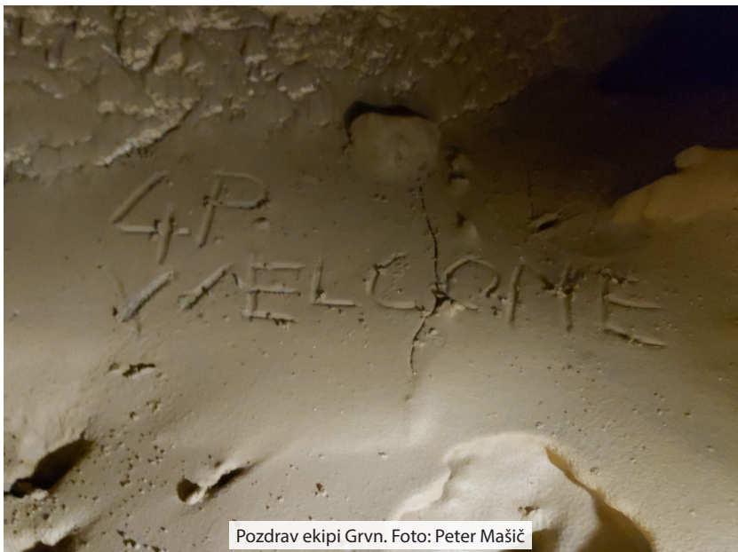
Pozdrav ekipi Grvn.