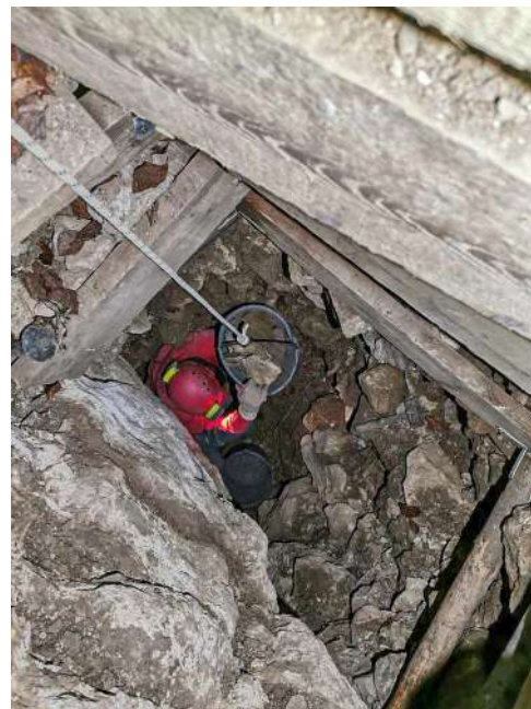
Levo: Na čelu kopanja v Radošci 2. Sredina: Opiranje izkopa v Radošci 2. Desno: Naloženo vedro za transport izkopanega materiala.