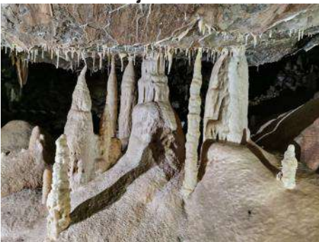
Kapniško stebrišče v dvorani Ponvice.