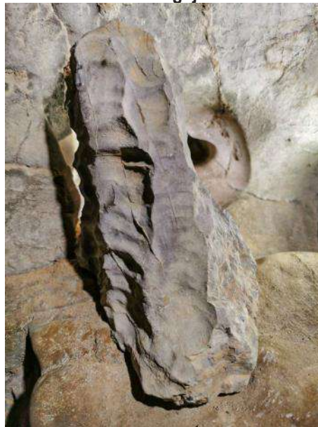
Kamniti gojzar iz Radošce 2, v oknu do Stranskega rova Skednene jame.

Februar se je začel pred Petnjakom, nadaljeval pa z jamo Malanco, ki je v marsičem podobna Tavčarjevi jami, le da je bližje Sežani. Bolj točno bi rekli, da je desno ob cesti Sežana–Lipica, malo pred daljnovodom, onkraj katerega se začne parada velikih in globokih jam z Lipiško na čelu.