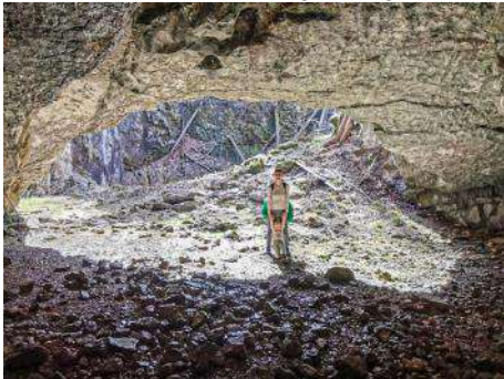
Alla in Solja v severnem vhodu Skednene jame.

Aprila se je odkopavanje v Radošci 2 nadaljevalo s klasičnim prodiranjem med steno in podorom. Pot nakopanega kamena na površje pa je postajala vse daljša in ni šlo več v enem nemotenem potegu. Poševen prehod na globini šest metrov je zahteval še enega člana več, ki je na »releju« poskrbel, da se vedro ni zatikalo ali, bogne daj, celo prevrnilo. Padajoče kamenje bi potem dobila spodnja posadka naravnost na glavo.