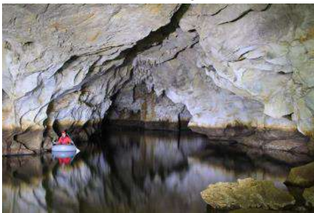
Pogled iz Pristana gorvodno, proti vzhodu.

Jamarski november se je začel 12. dne, z Radošco 2, na moker jesenski dan. Na dnu se je ob steni začela odpirati obetajoča, sicer ne prav prostorna, praznina proti severu. Obetajoča tudi zato, ker če bi se odprl rov proti severu, bi peljal v nadaljevanje Najdene jame, proti jugu pa nazaj v to jamo.