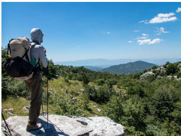
Levo: Tradicionalni tabor s Tommyjem v karanteni in družino Covington, ki se testira za COVID (test je bil pozitiven). Desno: Zopet v planinski raj, iskanje novih jam je s pogledom na Skadarsko jezero precej lažje, čeprav ne ublaži vročine.