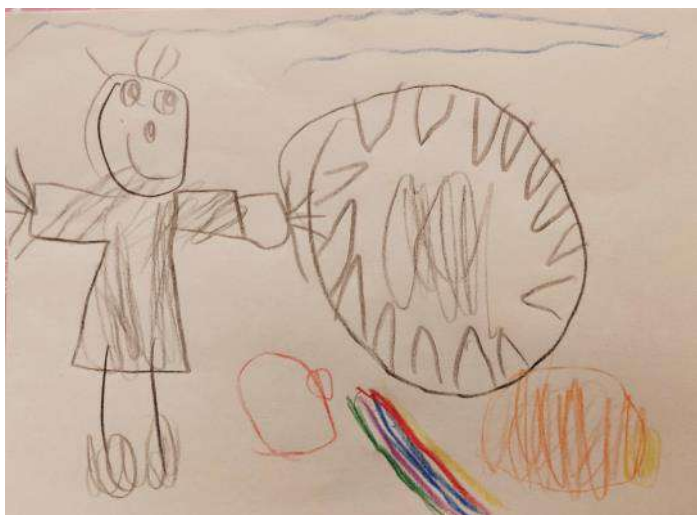
Ati je šel v jamo.