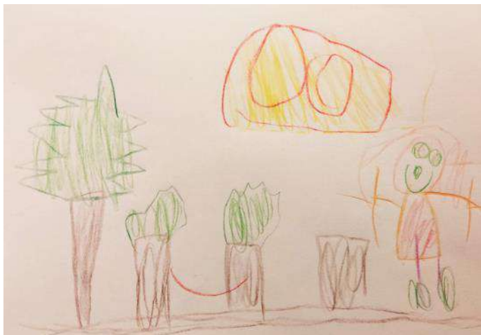
Prišli smo na jamarski tabor v Robidišče. Visim v mreži in hodim med bukvami.