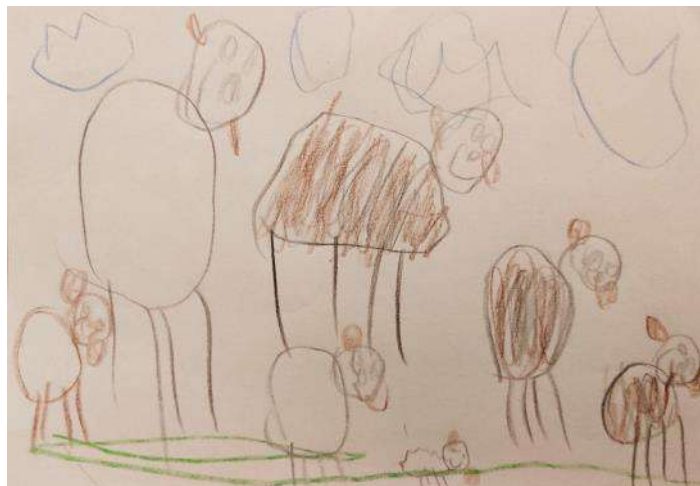
Šotore smo postavili v ograjo za ovce. Tri so črne in štiri bele.