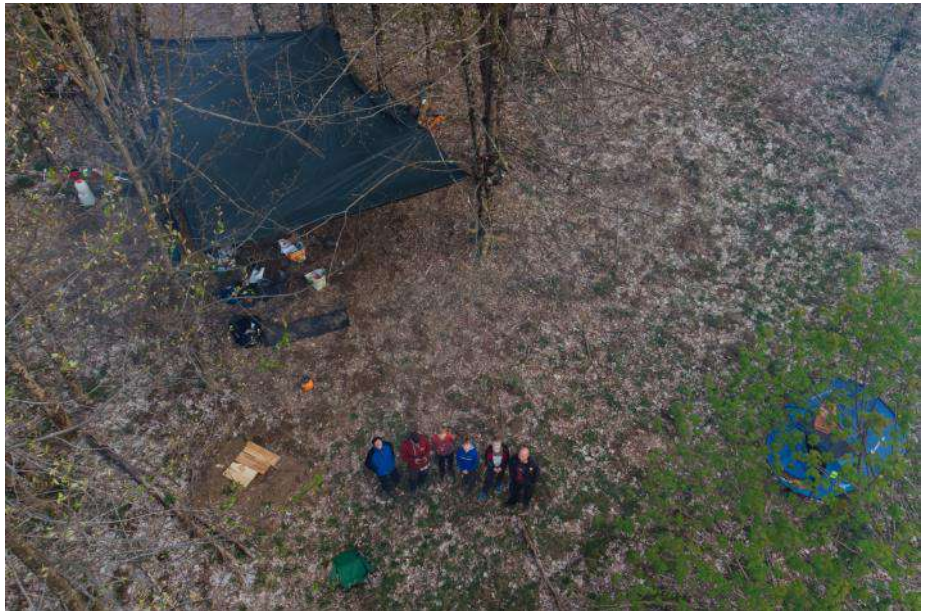
Bazni tabor.