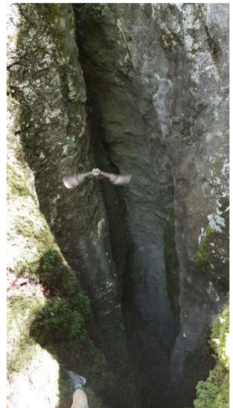
Ko te iz jame preseneti Sova.

S Fosilcem sva pred vrnitvijo v tabor odšla preverit še eno čurko. Ob ogledu sva ugotovila, da je jama, in jo izmerila. Jama je bila dolga 16 metrov in se je za-