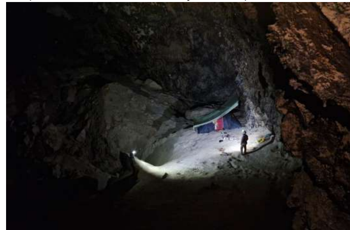
Stella od znotraj in od zunaj.