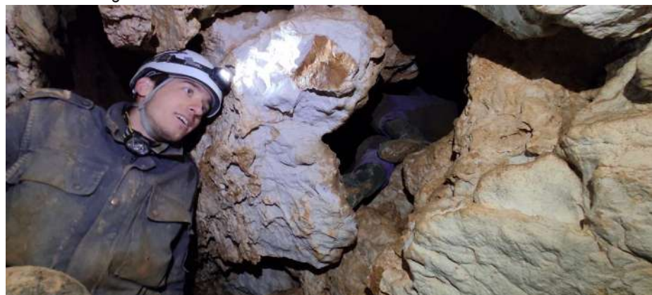
Levo: Vid je navdušen nad dvorano. Desno: Jama ima precej ovinkov.