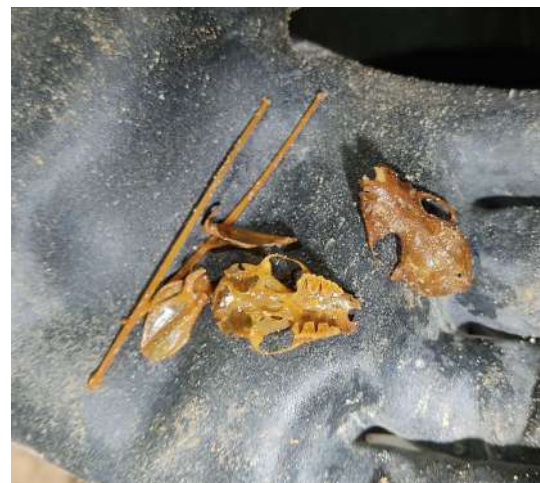
Look, matey, I know a dead bat when I see one, and I'm looking at one right now.

Pa še nekaj besed o netopirjih: V jami smo jih do zdaj našli precej, tako živih kot preminulih. Ob izhodu nam okoli glav verjetno leta navadni netopir ali več njih, tudi lobanje, pobrane iz plitvejših delov jame, pripadajo tej vrsti. Najglobljeja smo spremljali med spancem na globini 250 metrov. Na edini dosedanji zimski akciji smo prešteli tudi nekaj malih podkovnjakov, kar je jamo (po Primoževih podatkih) uvrstilo na prvo mesto po številu prezimovajočih malih podkovnjakov na takšni nadmorski višini. |