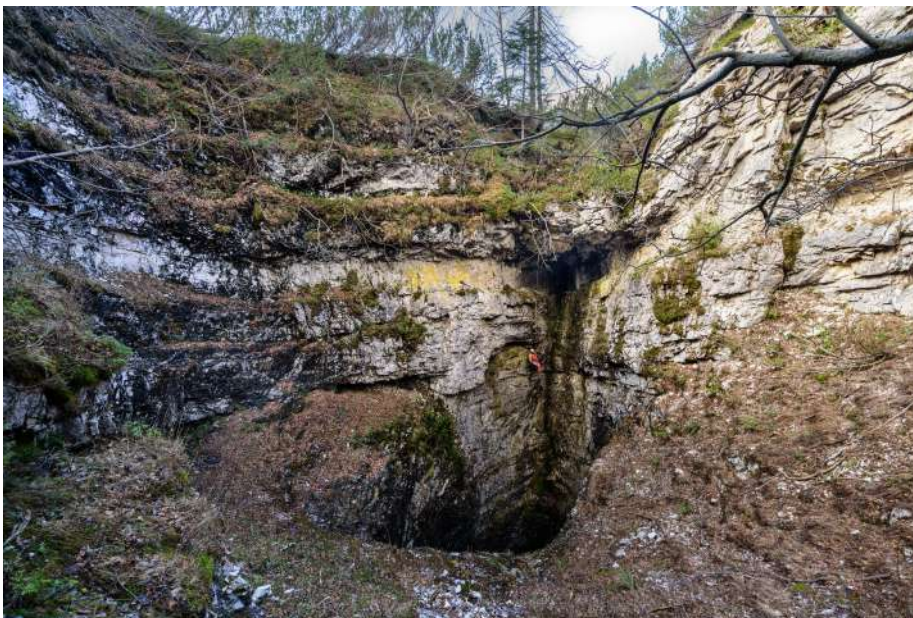
Vhod.