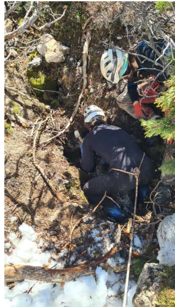
Odkopavanje vhoda.

Molilni volk, Iztegnjeni profil. Risal: Tomaž Krajnc. Merili: Tomaž Krajnc, Tim Berginc, Matevž Marinko, Peter Mašič, Matic Di Batista, Špela Borko, Lanko Marušič, Aljaž Osterman, Tinkara Kepic, Darja Kolar, itd. 2023