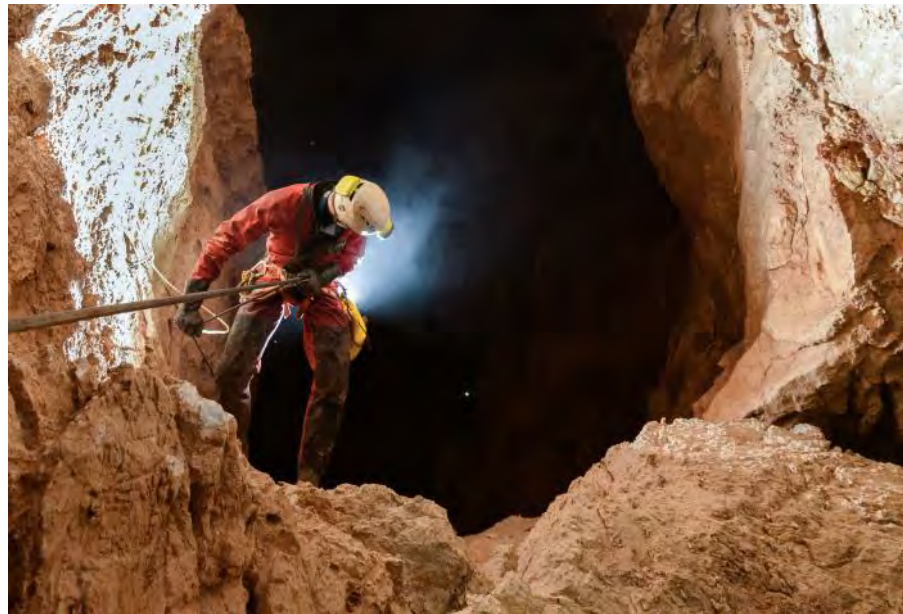
Prvih dvesto je prostornih in pretežno vertikalnih.