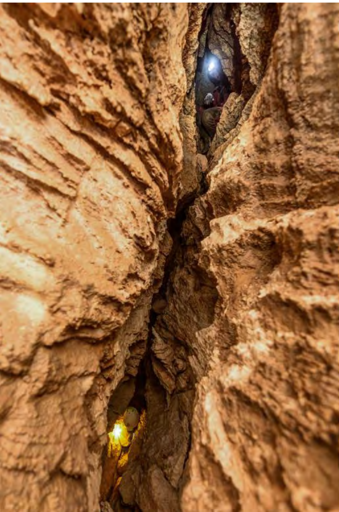
Meandriranje skozi razpadajoč meander v 4 - P.