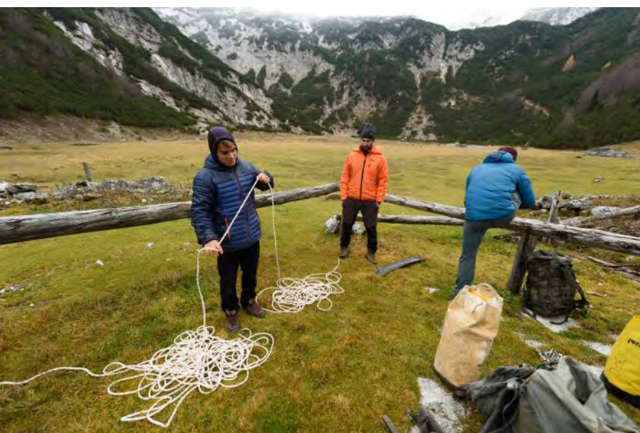
Avtor načrta raje premetava novo vrv kot sedi za računalnikom.