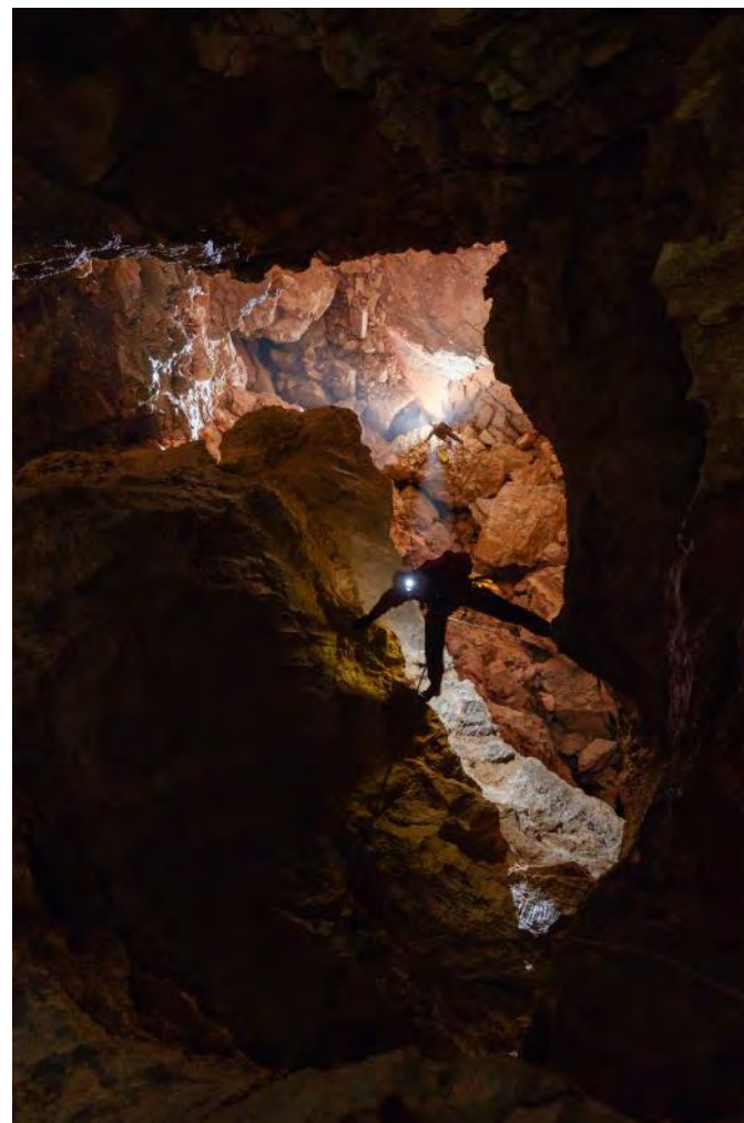
Nekje spodaj pod podorom se skriva vstop v 250 metrov vzdihovanja v ožinah.