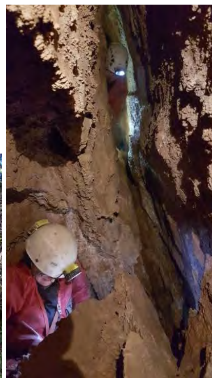
Levo: Hišna številka. Desno: Meander v 4 - P.