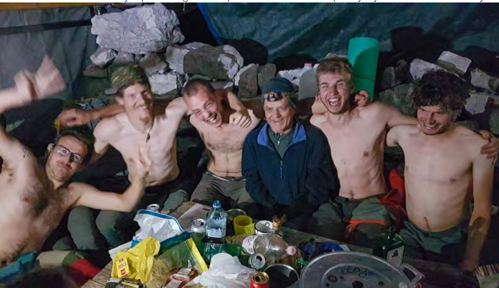
Sreča slači fante.