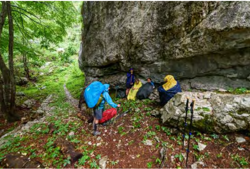
Pranje na poti na tabor.