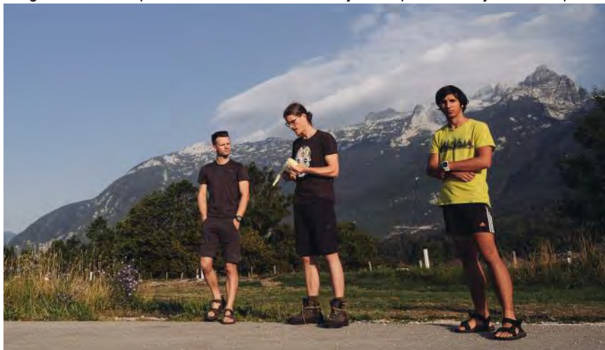
Levo: Sanjska ekipa YuBaCil. Zgoraj: DZRJL helikopterska enota.