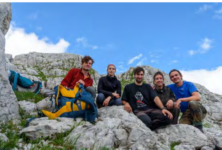
Ekipa Kave.