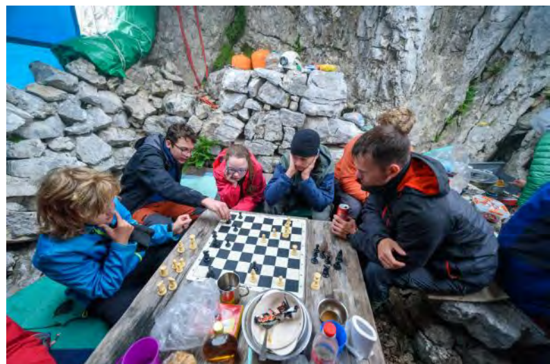
Obsesija 2021.