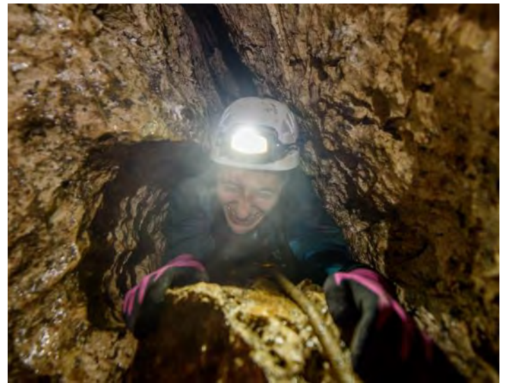
Levo: Gradnja Helidroma MDB. Desno: Nobena ni preozka!

Babanca. Ekipa pod Babancem smo naredili tri jame: LJ-69, 70 in 71. LJ-71 je jama pod balvanom, ki smo jo našli par dni nazaj. Na žalost se zapre.