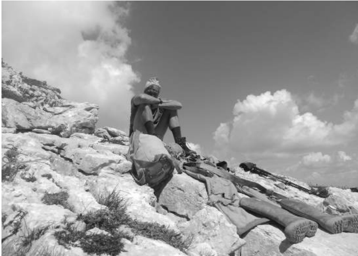
Zombi po povratku iz P4, avgust 2018.

ponujeno vodo izpod ledenika. Pa še to ni prav enostavno; predstavljamo si, da eni izmed mnogih poti, ki drenirajo ledenik, uspe. Ker je dovolj prevodna, lahko odvede več vode, tlak na njenem ustju pade, kar omogoči, da zajame več vode iz ledenika. Tudi ledenik je ene vrste vodonosnik, v tem primeru v stiku z nastajajočim kraškim. Tja, kjer je kraški najbolj učinkovit, se bo usmeril tudi tok v ledeniku. Skratka, najbolj uspela pot ne le, da najhitreje raste sama