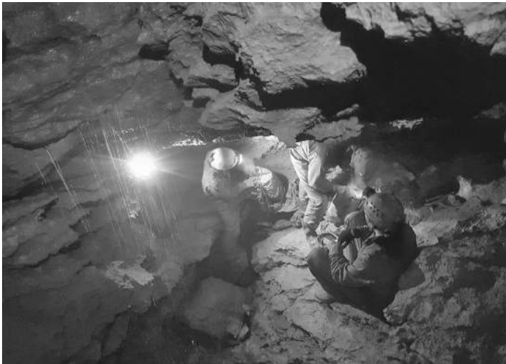
V spodnjih delih jame je precej vode, ki žal teče na jamarja.

Kakorkoli že, Evklidova je končno postregla s kar nekaj metri novih rofov. Vmes so sicer nekaj podobnega že uživali višje gor, v delih okoli Primovega labirinta. A glede na to, da ponovne akcije tja ni bilo več, jim ne verjamem, da so preveč uživali. Zgoraj napisano morda ni najboljši povzetek tega, kar se je v jami dogajalo v preteklih letih. Je bolj kot ne izliv gneva, ki ga človek nabere, ko se prevečkrat tlači skozi to razpoko. No, morda pa tudi ne ... Morda je le zanimiva reklama za najbolj zajebano jamo daleč naokoli. Spomin na Evklida je tako trdovraten, kot usrano blato iz spodnjih delov jame, ko se zažre v bele spodnjice.