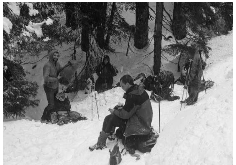
Vstop pozimi sicer sili jamarja k hitrejši pogubi v jamo, a je vseeno snega kar dobra izbira dokler ne pomrznejo prsti.