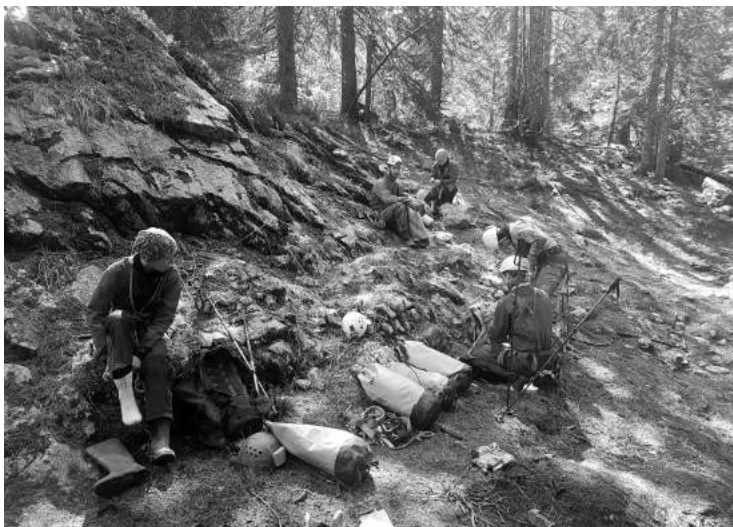
Lovljenje zadnjih sončnih žarkov pred začetkom kalvarije v pokljuškem podzemlju.

Luknja na koncu je rasla. Kak meter smo se lahko tudi sprehodili (po navadi po vseh štirih – zakaj bi vstajal, če pa boš kmalu spet na trebuhu, boku, glavi ...), večinoma pa neumorno praskali po Pokljuški skali. Nato se je situacija še bolj zaostila, saj smo naleteli na 100 m meandra, po