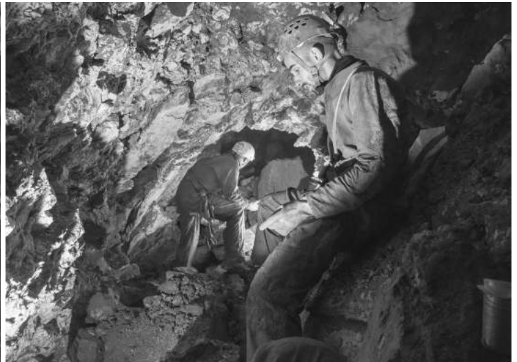
Ena malo starejša, slikana v silno prostornih delih jame.