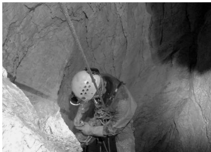
Avtor članka v Romeu.