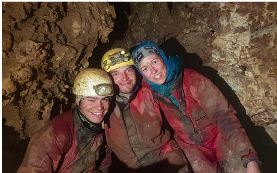
Levo: Pastiriška idila na Poljani. Zgoraj: Trio-adijo v globinah Grvna.

optimizirati do te mere, da je bilo mogoče priti na planino v pičlih treh urah in pol. Del ekipe je krpelje zamenjal za turne smuči in s tem so postali spusti prava milina. Padla je odločitev, da bomo pozimi namenili več časa raziskavam Rajže, Grvn in ostale jame bodo pa počakale na krajši poletni dostop. Do konca letošnjega januarja smo v Rajži namerili 588 metrov dolžine in 345 metrov globine. Po prvih akcijah je kazalo, da se bomo takoj povezali v končne dele Grvna, a na zadnji akciji je del jame zavil proti severovzhodu. Jama ima podobno tendenco kot vse na tem koncu – cepi se praktično na vsakem koraku. Zaenkrat smo poleg glavne poti do najgloblje točke raziskali