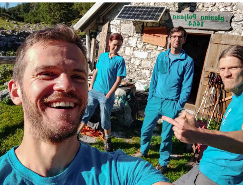
Modra je nova črna.

Jeseni se je situacija z virusom v državi spet počasi začela zaostrovati. Posledično so bile tudi raziskave otežene. Tisti, ki smo se še prebili do Poljane, smo se osredotočili na Grvn. V spodnjih delih smo se povezali v dele, raziskane v prejšnjih mesecih. To je omogočilo hitrejši prehod do dna jame. Tam smo naleteli na rov, ki se je z ogromno količino prepaha odcepil proti severozahodu. Na več akcijah smo raziskali dovolj, da se Grvn sedaj ponaša z 4.464 metri dolžine in 453 metri globine. Na zadnjih akcijah smo večinoma sledili le najbolj očitnemu nadaljevanju – vsa brezna in odcepe smo pustili za prihodnje obiske. Imamo pa v teh delih manjšo težavo, saj so zelo blatni. Blato precej oteži povratek iz jame in zato smo se začeli ozirati v ogromne kamine/dvorane, ki presekajo nove dele. Konec leta smo pregledali teren nad končnimi deli – jugovzhodno pobočje Gradovca – in res naleteli na več močnih dihalnikov. V vseh pa bodo žal potrebna fizična dela za preboj v globine.