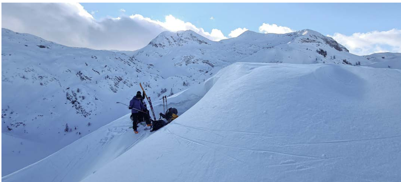
Nad Poljano, na vrh hriba, črna luknja sredi belega polja.