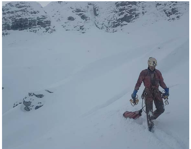
Levo: Pridelovanje D-vitamina pred Renejem. Desno: Matic ob izstopu.

verjeten. In res, na globini 250 metrov je brezna že tako zalivalo, da smo zgolj pobrali vzorce in hitro odžimarili ven. Globlji vzorci pa so počakali na poletje.