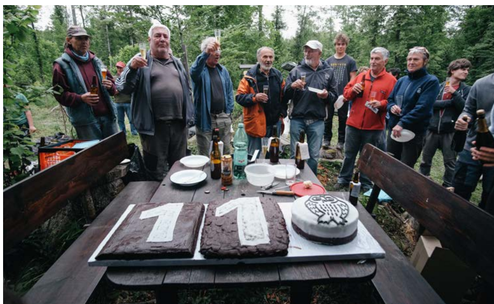
Na 110!

Člansko! Metod, Manč in ostali veterani |