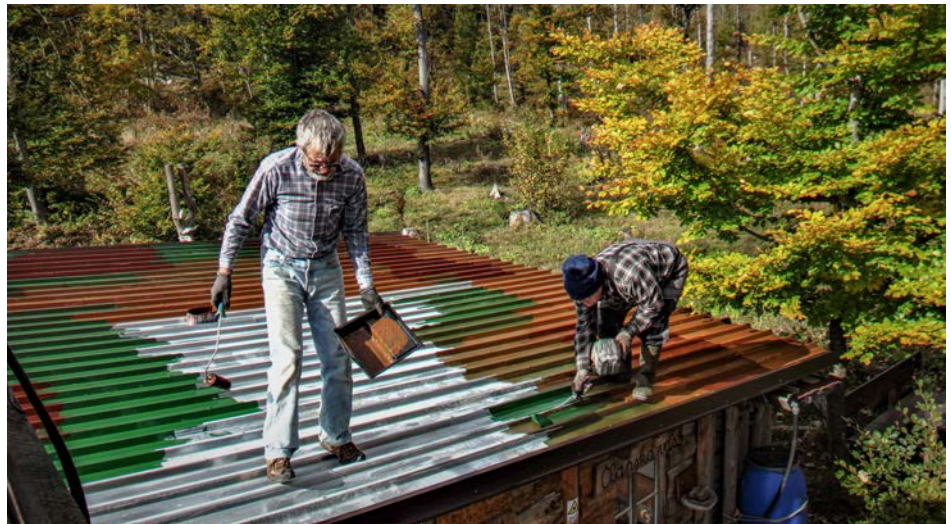
Tudi barva strehe bo trajnostna in sonaravna – 21. 10. 2020.

Kot sem že omenil, smo na področju udornice Radošce odprli novo delovišče. Na osnovi meritev smo ugotovili, da je podor v rovu v Radošci pod navpično steno udornice. Razlika od površja do znanega rova je nekaj metrov. Zato smo sklenili, da se bomo zadeve lotili bolj »strokovno« in poskušali od zgoraj najti