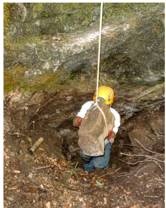
Levo: Radošča-2, Prve lopate – 2. 9. 2020. Desno: Radošča-2, Tudi take smo vlekli ven – 9. 9. 2020.