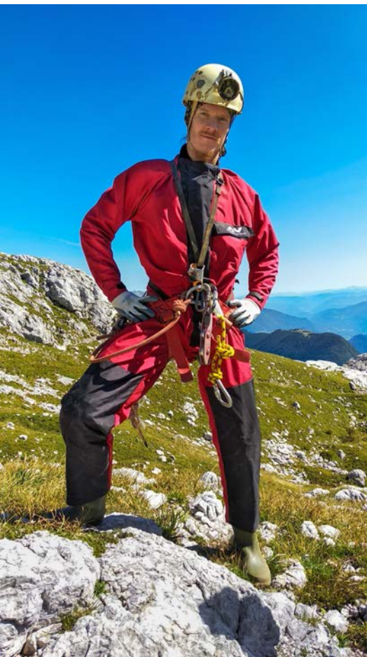
Precednik ma vas rad.

Če na koncu povzamem, je bilo leto 2020 zelo čudno leto. Predvsem zato, ker smo ves čas plavali med stanjem, ko je vse normalno, ter stanjem, ki je daleč od tega. Vseeno pa smo zelo dobro krmarili ter poskrbeli, da je članski duh ostal in se pri marsikomu morda še okrepil. Društvo in društveni duh je lahko v trenutkih, ki jih je bilo v lanskem letu polno, bilka, ki se je marsikdo oprime, da mu pomaga skozi čas, ko vse izgleda črno. Lahko pomaga, da spregledamo, da nas na koncu rova čaka luč, prehod na površje, kjer je pivo vedno boljše, hrana okusnejša, zgodbe in sreča pa postanejo slajše šele, ko jih delimo. |