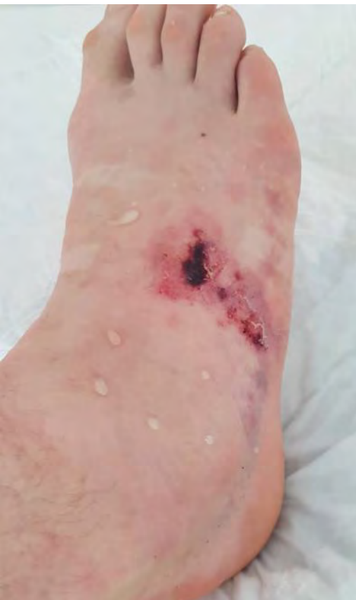
Diagnoza: nekroza.

Bi lahko nesrečo preprečil? Morda. Najverjetneje pa ne. Skala je bila poznana rednim obiskovalcem jame in se je od vekomaj premikala. Vsi so stopali po njej, pa ni hotela pasti. Takrat pa je. Če ura ne bi bila tako pozna, če bi bil bolj naspan, bi še vedno stopil na isto skalo. Če bi se vpel s popkovino na »prečko«, bi padel ravno tako globoko (pa bi se vseeno moral). Edino kar bi lahko rešilo nogo pred skalo je, da bi jo povlekel nazaj v tistem trenutku. Pa še to vprašanje, če bi bilo mogoče. |