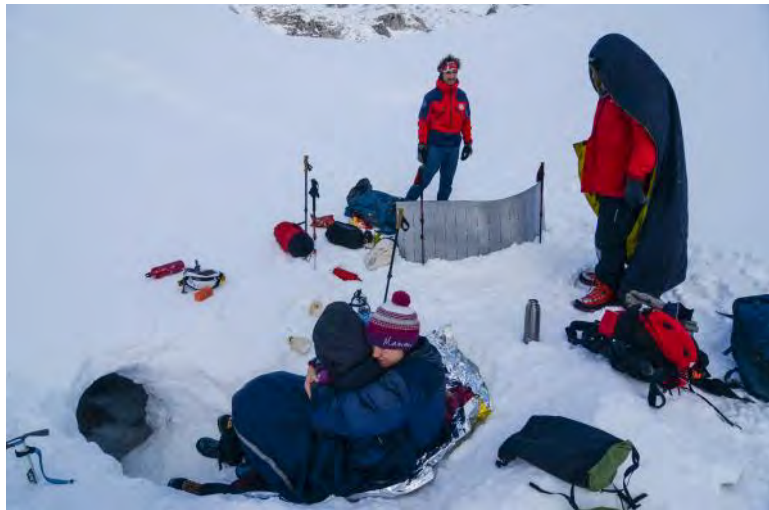
Help has come.

move towards a more covered zone. We are on the edge of a big doline, Veliki Dol. In my mind only two thoughts: don't make mistakes and find a shelter as soon as possible. I start digging a snow cave, Andrej goes out searching for phone signal to call for help. Darja is near me, she is protected by my sleeping mat, since it's the only shelter from the wind that I am able to provide her. I am digging with my ice axe, the snow is hard and icy, and is goddamn scarce. After one hour and a half I break one part of the roof of the small shelter. I will need to start again from scratch. Darja is in the snow cave, inside the sleeping bag. She fights like a lioness, she tells me that she is fine, I tell her that she will need to stay there for some time, alone,