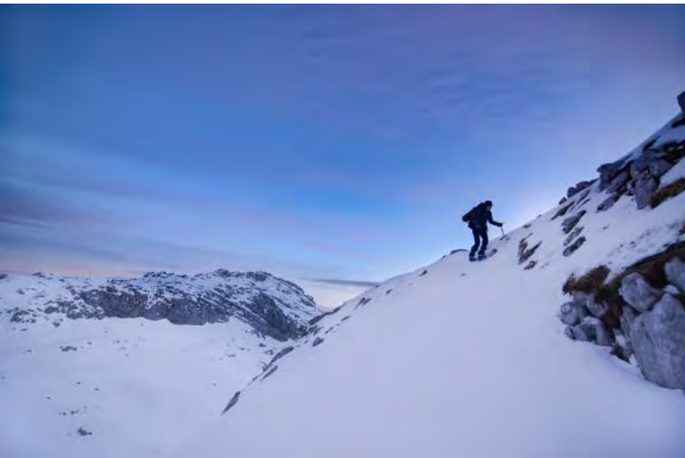
Darja some moments before the incident.