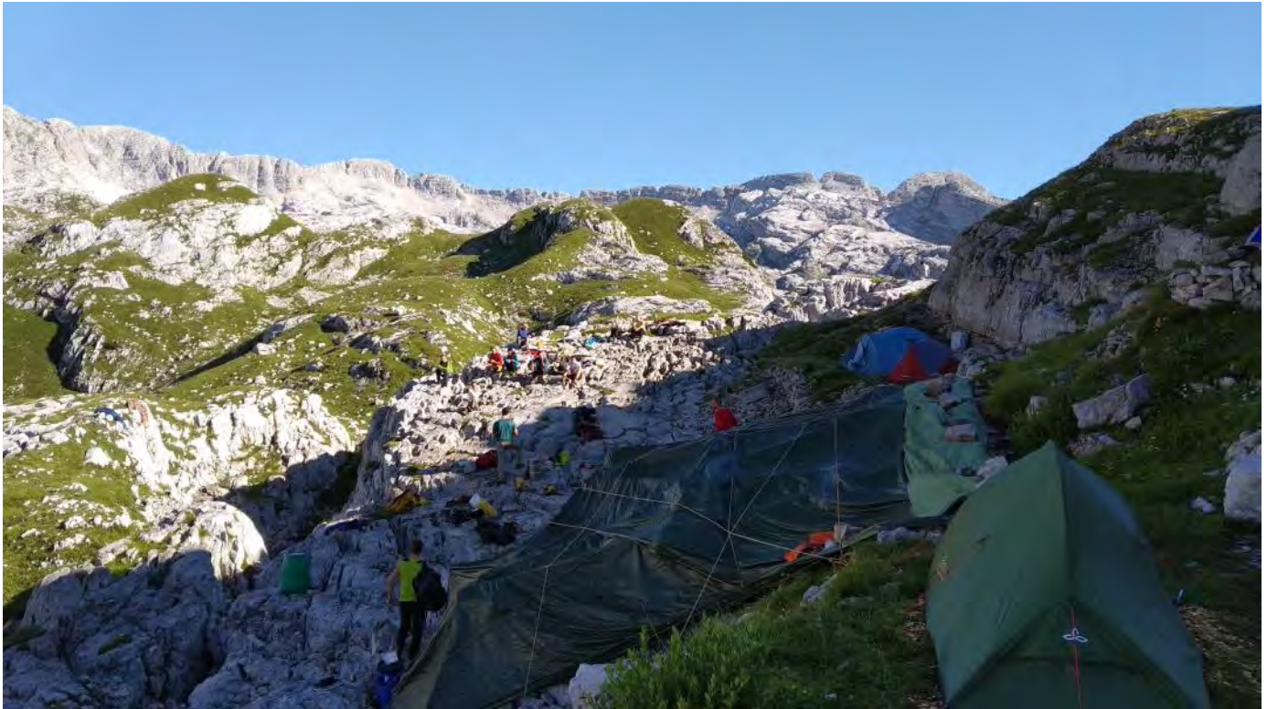
Kanin, naš ljubi poletni dom.