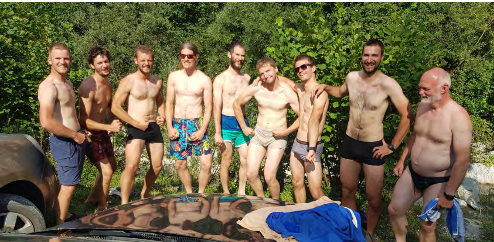
Radnički rokavi in napete mišice smetane ferajnovih decov.