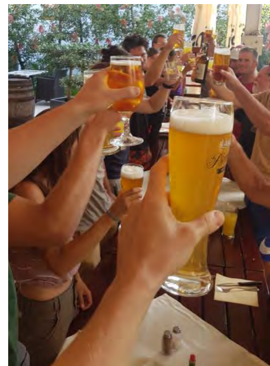
Post-taborsko vzdušje.

Ekipe Diba, Nika, Bor, Špela smo dokončali LJ-13 (-135 m) in Udornico ob Vrtiglavici. Diba je odnesel 200 m štrika do P4. Marjan je bil pri zveznikih, pred tem pa je odnesel 200 m do LJ-13.