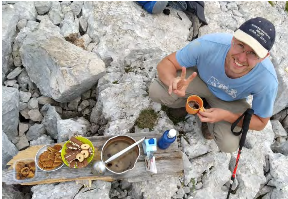
Ta najbolj za oženit.