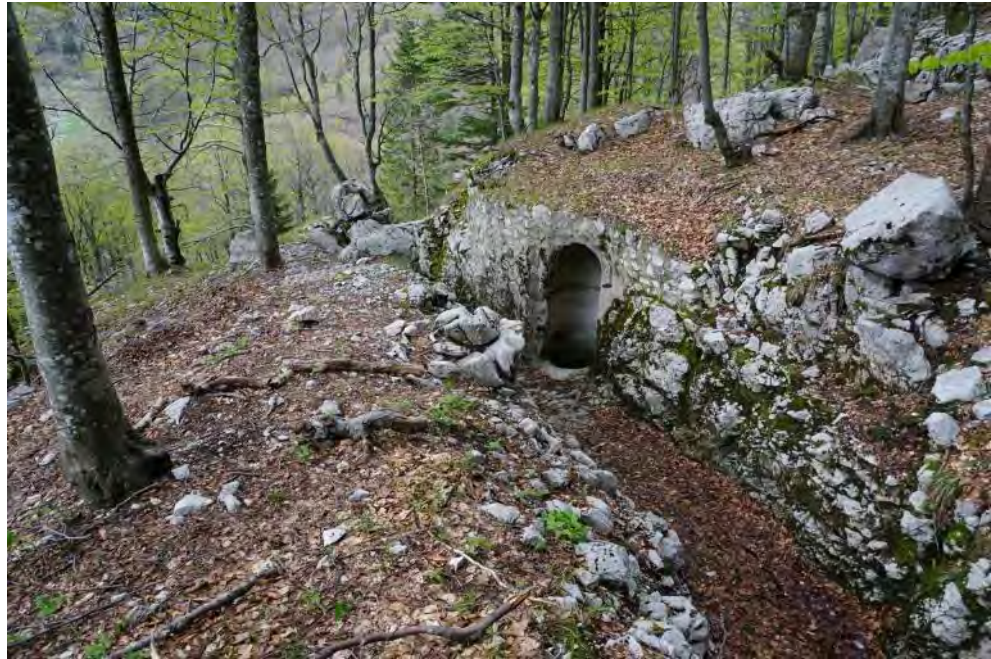
Vhod v kaverno.

Ekipa Jaroš, Tomaž, Ester, Nika, Tjaša in Matevž je šla izmeriti najdeno jamo prejšnjega dne, Primož pa je pazil na vreme in še malo raziskoval po okolici. Jama je požrla celo dvestometrco, razpoloženje je bilo na vrhuncu, le pri vzpenjajočih jamarkah in jamarjih je lahkotnost izstopa začela zbujati dvome o dolžini vrvi. Meritve so dodale svoje in začeli smo premišljati, da je treba pri gospodarju preveriti, kako skladišči opremo, da so se vrvi skrčile za polovico. Malo smo se pogovarjali o imenu. Jama je bila gotovo že raziskana, o čimer je pričal svedrovec na vrhu brezna. Stari je vedel, da so spodaj na obračališču leta nazaj taborili italijanski jamarji iz Mantove, zato je bil eden od predlogov za ime Grazie mille, ker so nam jamo pustili neregistrirano. To ime pa je naletelo na ostro nasprotovanje, da italijanskih imen že ne bomo dajali, sploh pa ne tu, kjer je potekala fronta! No, potem je bilo jami dano delovno ime Stari grehi. Nazaj grede smo si ogledali še muzej v naravi, ki ga predstavlja nekaj obnovljenih italijanskih frontnih jar-kov in tunelov.