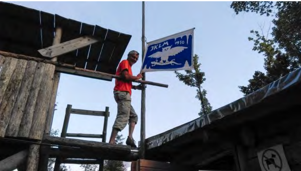
Naša zastava v članski vasi, 10. 7. 2019.

nega odgovora. Vsak član in vsak jamar ima za ta ZAKAJ zelo osebni ZATO!