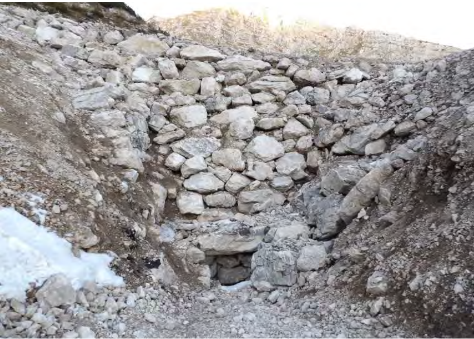
Pogled na vhod in zložbo nad njim s poti k njem. 25. julij 2017.

no odkopati vhod, vendar so prodrli le meter globoko.