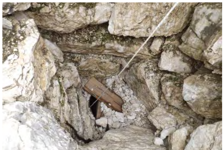
Levo: cev v prazni vhodni luknji, 12. november 2015. Desno: Pogled na vhodno cev in zložbo ter del stene nad cevjo. 11. julij 2019.