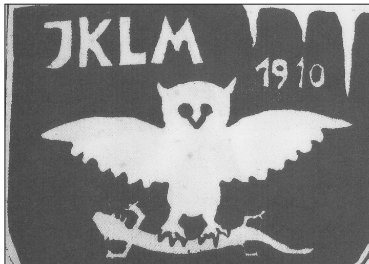
Prapor JKLM 28.

Pripis: Težav, ki so nas oblikovale, nisem naštel v celoti. Upam pa, da sem dovolj dobro orisal vzdušje, v katerem smo morali preživeti. Čeprav smo imeli »inštitut« takrat za skorajda dednega sovražnika, ga kot ustanove nikakor ne želim grditi. SAZU in njene veje nimajo pri tem nič. Krinko DZRJS{z} – in v polsenci za njim IZRK – je uzurpirala peščica ljudi, ki je tako pač tešila svoje osebne in strokovne travme. Se pa iz tedanjega dogajanja da marsikaj naučiti. Predvsem to, da je treba zadeve dobro premisliti vnaprej. Če društvo v drugi polovici 60-ih let ni razpadlo, je v veliki meri zaslužen slučaj, da se je ob pravem času na pravem mestu znašlo dovolj ljudi, ki s(m)o znali stopiti skupaj.