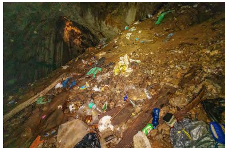
Levo: Iz obeh jam smo izvlekli za cel kontejner odpadkov. Desno in zgoraj: Žal je vhodno brezno, kot tudi celotna dvorana Jeriševe jame, prekrito z odpadki.